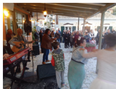
Κούλουμα στη Λάκκα

Κάθε χρόνο, καθώς πλησιάζει η άνοιξη η Καθαρά Δευτέρα γιορτάζεται με μεγάλη χαρά και ενθουσιασμό στο νησί μας. Είναι η μέρα που σηματοδο-